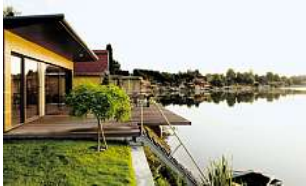
54 m 2 „Sonnendeck“ als erweiterter Wohnraum