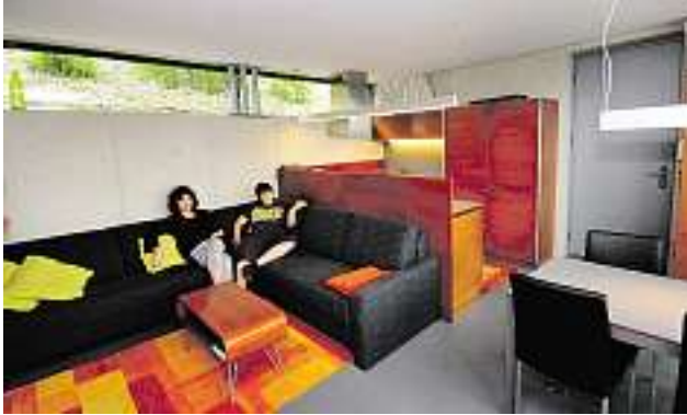
Die (Sichtbeton-)Rückwand ist Stützmauer gegen den Hang