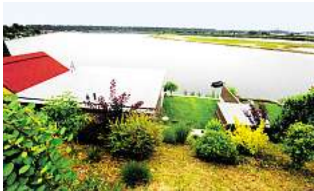
Von der Straße aus zeigt sich nur das graue Foliendach