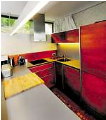
Das Birkenperrholz der Möbel wurde auf Sapelli (Schiffbauholz) gebeizt