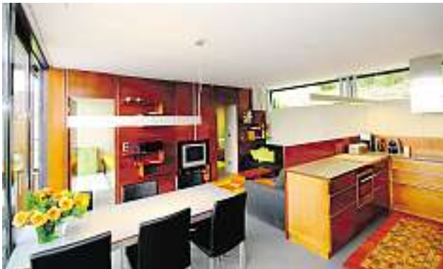
Eine „Funktionswand“ als Trennung zu Schlafbereich und Bad